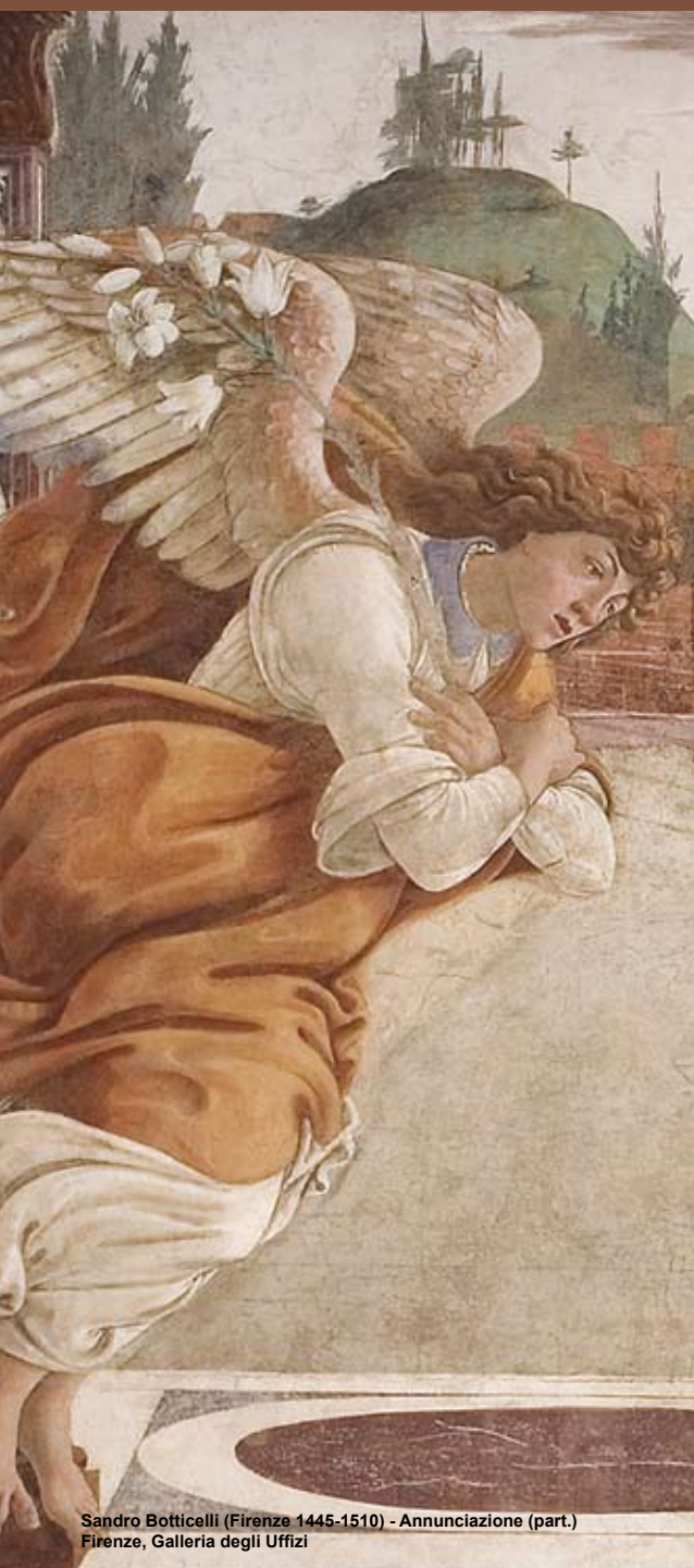
Sandro Botticelli (Firenze 1445-1510) - Annunciazione (part.) Firenze, Galleria degli Uffizi